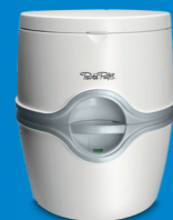
Porta Potti 565

Le Porta Potti est un système sanitaire autonome, compact et léger. Vous pouvez installer ces toilettes portables où bon vous semble. Les Porta Potti sont souvent utilisés dans les caravanes pliantes, les tentes, les camping-cars et les bateaux. Ils peuvent également s'avérer pratiques à la maison lors de travaux, ou dans les résidences d'été ou cabanons de jardin. Ils peuvent être installés dans n'importe quelle pièce de la maison et sont adaptés à tous les âges, même en cas de mobilité réduite.