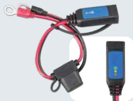
Batterie indicateur œillets M8

Mallette de transport pour chargeurs et accessoires